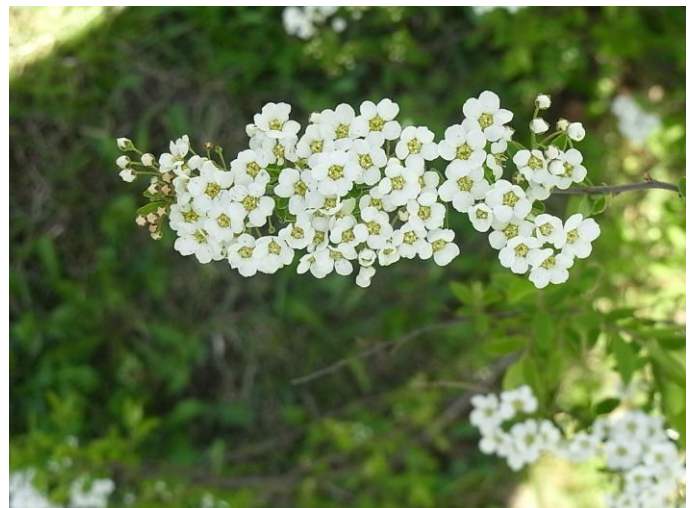
Norjanangervot myös kukkivat ensi kuussa.